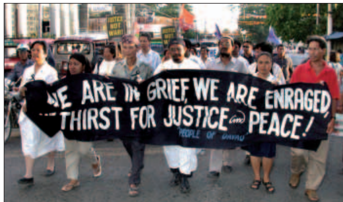
Foto tomada por Paul Jeffrey/Acción Conjunta de las Iglesias (ACT), marzo de 2003

El tema de la duodécima Asamblea General de la Conferencia Cristiana de Asia (CCA) lo es también del foco de atención del DSV (Decenio para Superar la Violencia) en Asia en 2005. Cuando el Consejo Mundial de Iglesias, que inició el DSV, decidió centrar la atención en Asia en 2005, el personal de la CCA sintió que “Construir comunidades de paz para todos” entra también dentro del tema general del DSV “Las iglesias en busca de reconciliación y de paz”, pero con un claro enfoque asiático. El tema refleja una llamada y un compromiso hacia una tarea y una visión en el contexto de la diversidad religiosa y étnica de Asia y la búsqueda en curso de la armonía comunal. Por lo tanto, vivir en Asia ya no puede ser concebido románticamente como llegar a ser una comunidad, sino como vivir juntos en tanto que muchas comunidades diversas que permanecen unidas por la misma visión de paz para todos.